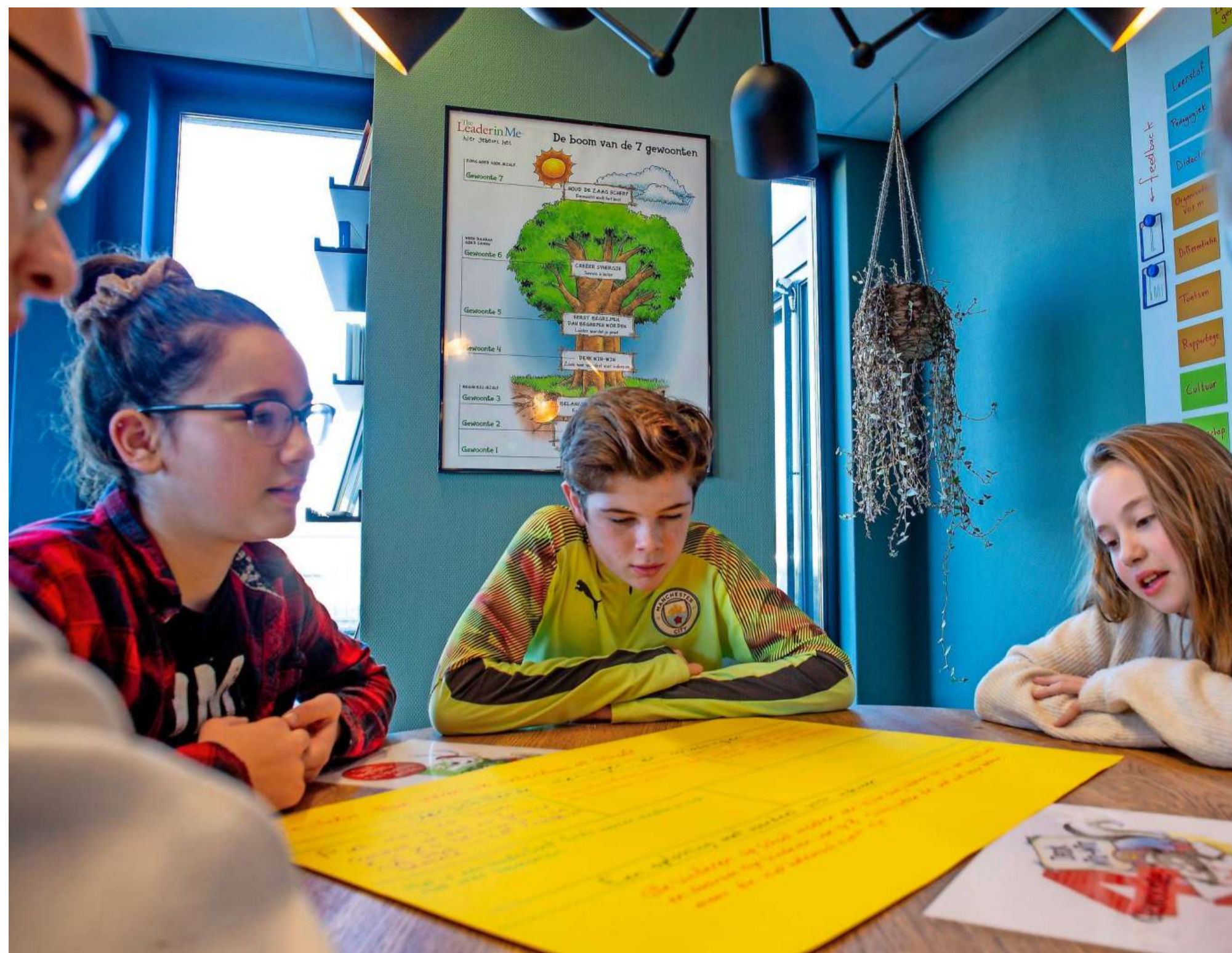
Leerlingen van basisschool De Windwijzer buigen zich over verschillende standpunten die zijn verzameld.

„Het is mooi om te zien dat er, ondanks eigen meningen en opvattingen, naar elkaar geluisterd wordt. Daar kunnen volwassen een voorbeeld aan nemen.”